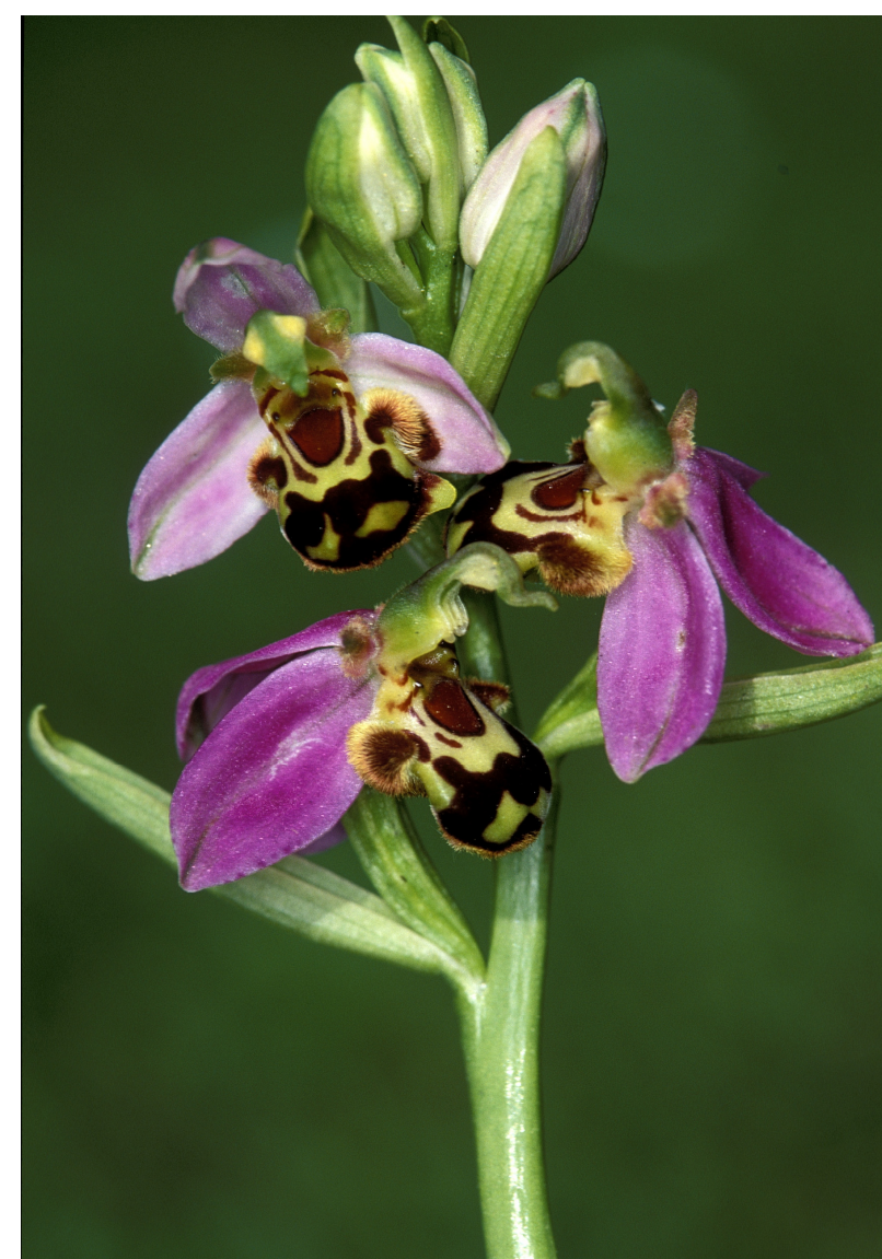
L'ophrys abeille est fréquent dans les jardins.

Notez les taches brunes qui couvrent les feuilles, elles ne sont pas toujours présentes !