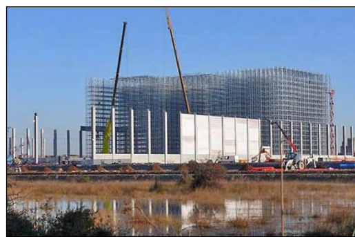
Construction d'un entrepôt sur prairies humides