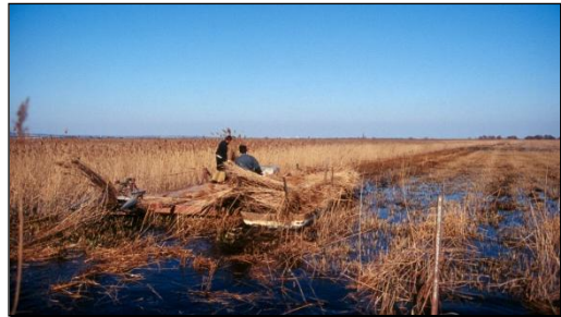
Récolte de la sagne sur l'étang du Charnier

La présence de plusieurs collectivités territoriales de protection et de gestion des zones humides telles que le Parc naturel régional de Camargue, le Syndicat Mixte pour la protection et la gestion de la Camargue gardoise ou le Syndicat Mixte de gestion de l'étang de l'Or, concourt globalement à la conservation spatiale des zones humides. La présence de nombreux espaces protégés sur ce territoire peut garantir localement une gestion des milieux adaptés (Réserve nationale de Camargue, Réserves régionales du Vigueirat, de la Tour du Valat ou du Scamandre, terrains du Conservatoire du Littoral). Des destructions de zones humides sont cependant toujours programmées en bordures des zones urbaines ou touristiques (Grau-du-Roi), dans le cadre d'une intensification des pratiques agricoles ou dans le cadre de l'extension de la zone industrialo-portuaire de Fos-sur-Mer et de nombreuses stations d'orchidées (parfois protégées) sont encore menacées en Camargue.