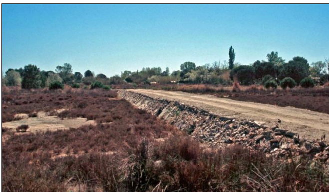
Remblaiement d'une sansouire pour créer une piste carrossable

Si les efforts de conservation doivent être maintenus et développés, la gestion concertée des milieux doit être la priorité sur ce territoire camarguais afin de conserver des zones humides diversifiées et des niveaux d'eau équilibrés à l'échelle du delta et plus généralement de l'ensemble des zones humides littorales méditerranéennes.