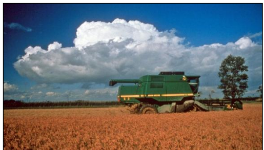
Culture du riz au nord de l'étang du Vaccarès

Si les zones humides sont globalement préservées quantitativement, le constat est malheureusement différent qualitativement... Les nombreux conflits d'usage autour de ces zones humides (pêche, chasse, élevage, exploitation du roseau, sel) dégradent souvent la qualité environnementale des marais méditerranéens et notamment des marais temporaires et des prairies humides. Il faut noter l'importance de l'élevage traditionnel des taureaux et des chevaux de Camargue essentiels pour la conservation de ces zones humides et le maintien de milieux ouverts favorables aux orchidées.