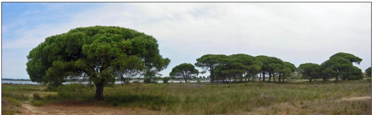
Pinède près de l'étang du Ponant

Si certaines espèces d'orchidées patrimoniales sont parfois présentes en stations très localisées (Dactylorhize d'Occitanie, Epipactis des marais, Ophrys noirâtre), d'autres sont caractérisées par la présence de stations parfois très denses (Orchis odorant, Spiranthe d'été) en Camargue laguno-marine ou en Camargue fluvio-lacustre.