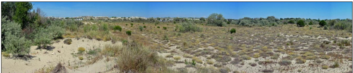
Arrière-dunes au sud de Port-Camargue

D'autres milieux (notamment boisés) abritent également des orchidées :